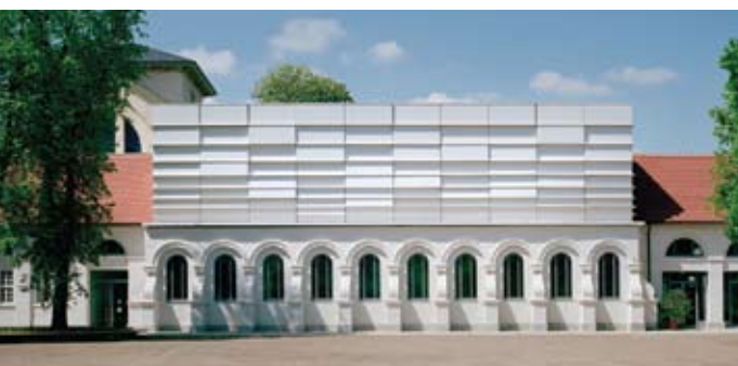
Johann-Sebastian-Bach Saal Schloss Köthen von BUSMANN + HABERER, Gesellschaft von Architekten mbH. Eines der drei Preisträgerprojekte des Fassadenpreises 2009 für VHF.