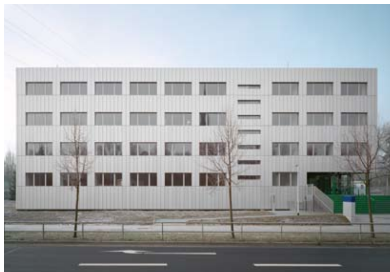
Sanierung und Neugestaltung Polizeirevier Chemnitz-Süd von schulz&schulz Architekten GmbH, Preisträgerprojekt beim Fassadenpreis 2009 für VHF.

Auslober und Organisatoren übernehmen keine Haftung für eventuelle Transportschäden oder -verluste. Die Unterlagen gehen in das Eigentum des FVHF e.V. über und werden nicht zurückgeschickt.