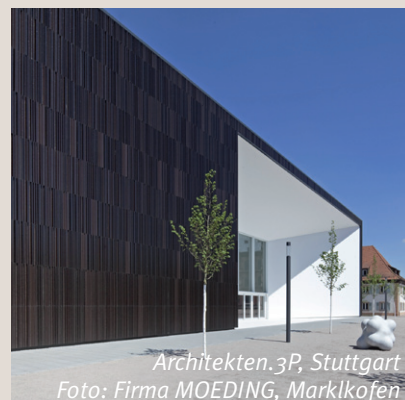
Architekten.3P, Stuttgart

Wir freuen uns auf Ihr Kommen und bitten um verbindliche Anmeldung bis 03.09.2015 unter www.FVHF.de