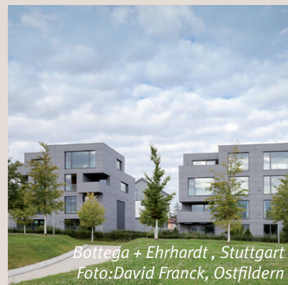
Bottega + Ehrhardt, Stuttgart