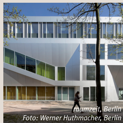
raumzeit, Berlin