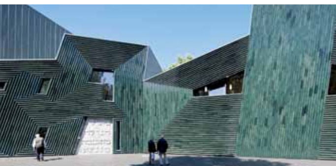
Der Deutsche Fassadenpreis 2011 für VHF: Das Jüdische Gemeindezentrum Mainz. Manuel Herz Architekten, Köln/Basel, Foto: Ivan Baan, Amsterdam (NL)

Die Jury tagt nicht öffentlich. Ihre Entscheidungen sind endgültig. Die Jury entscheidet mit einfacher Mehrheit und begründet ihre Entscheidung in einem einfachen Votum. Der Rechtsweg ist ausgeschlossen. Die Jury ist beschlussfähig, wenn mindestens fünf Mitglieder anwesend sind.