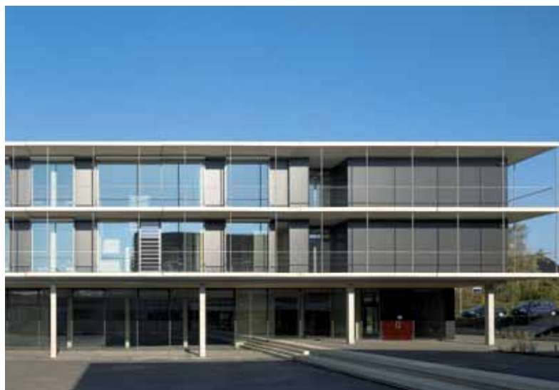
Eine der Auszeichnungen von 2011: Umbau und Erweiterungsneubau Inda-Gymnasium, Aachen. Harter + Kanzler, Freie Architekten BDA, Freiburg

Auslober und Organisatoren übernehmen keine Haftung für eventuelle Transportschäden oder -verluste. Die Unterlagen gehen in das Eigentum des FVHF e.V. über und werden nicht zurückgeschickt.