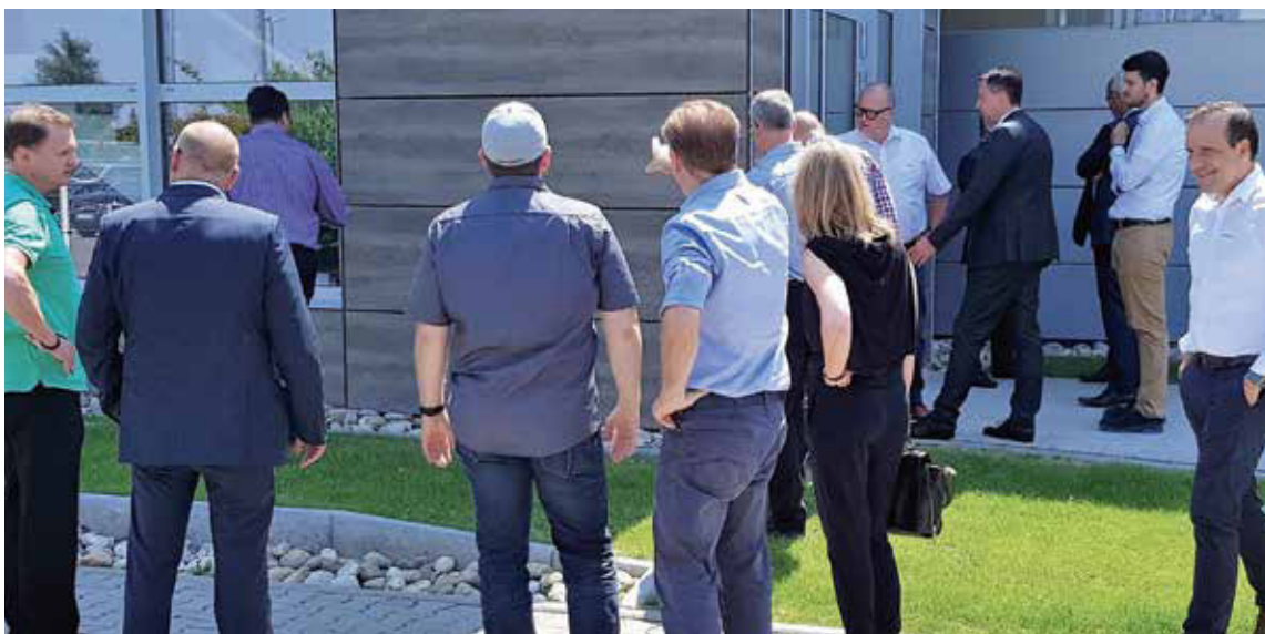
»Mitglieder für Mitglieder« – zu Besuch bei Renolit in Worms

Das neue Konzept »Mitglieder für Mitglieder« integriert neue Mitglieder in die inhaltliche Verbandsarbeit und in das »FVHF-Kompetenznetzwerk«, fördert die Entwicklung der Bauart VHF und seiner Anwendungen, selbstverständlich auf der Grundlage einer umfangreichen und rechtssicheren » FVHF-Richtlinie zur Kartellrechtskonformität «.